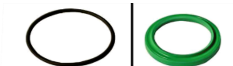
4600605: КОЛЬЦЕВАЯ ПРОКЛАДКА ИЗ ФТОРСОДЕРЖАЩЕГО ЭЛАСТОМЕРА