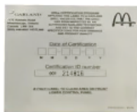
4518261: ЭТИКЕТКА СО СТРОКОЙ СТРОКОЙ

ПЛАНОВО-ПРОФИЛАКТИЧЕСКОЕ ТЕХНИЧЕСКОЕ ОБСЛУЖИВАНИЕ / КОНТРОЛЬНЫЙ ПЕРЕЧЕНЬ РАБОТ ПО СЕРТИФИКАЦИИ