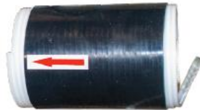
4604306: СИЛИКОНОВАЯ ТРУБКА ХОЛОДНОЙ УСАДКИ 70 ММ