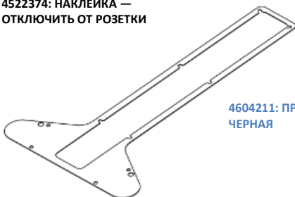
4604211: ПРОКЛАДКА КРЫШКИ РЫЧАГА, ЧЕРНАЯ