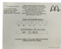
4518261: ETICHETTA CERT. RIGA