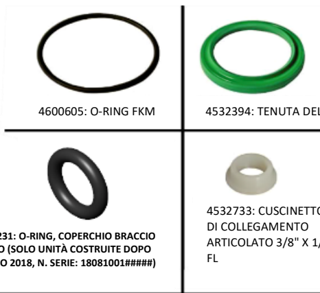
4600605: O-RING FKM