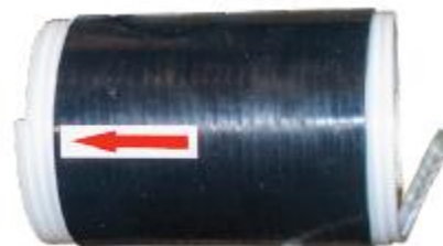
4604306: TUBAZIONE IN SILICONE RETRATTILE A FREDDO 70 MM