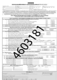
LISTA DI CONTROLLO DI MANUTENZIONE PREVENTIVA/CERTIFICAZIONE