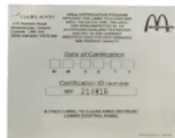
4518261 : ÉTIQUETTE CERTIFICATION